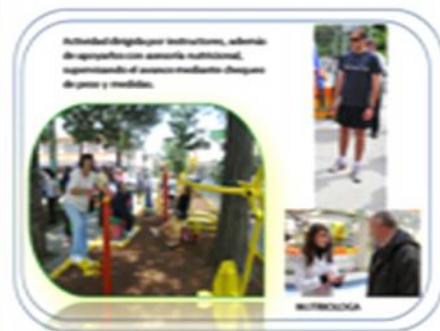
Ejecución del Proyecto.

Para la selección de los aparatos se consideró que estos deberían ser principalmente para quemar masa corporal y por consiguiente acondicionamiento físico.