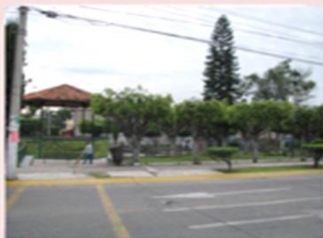
Ubicación del Espacio.