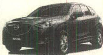
Mazda CX-5 2015

Total de comisiones cobradas en el Periodo: $235.00