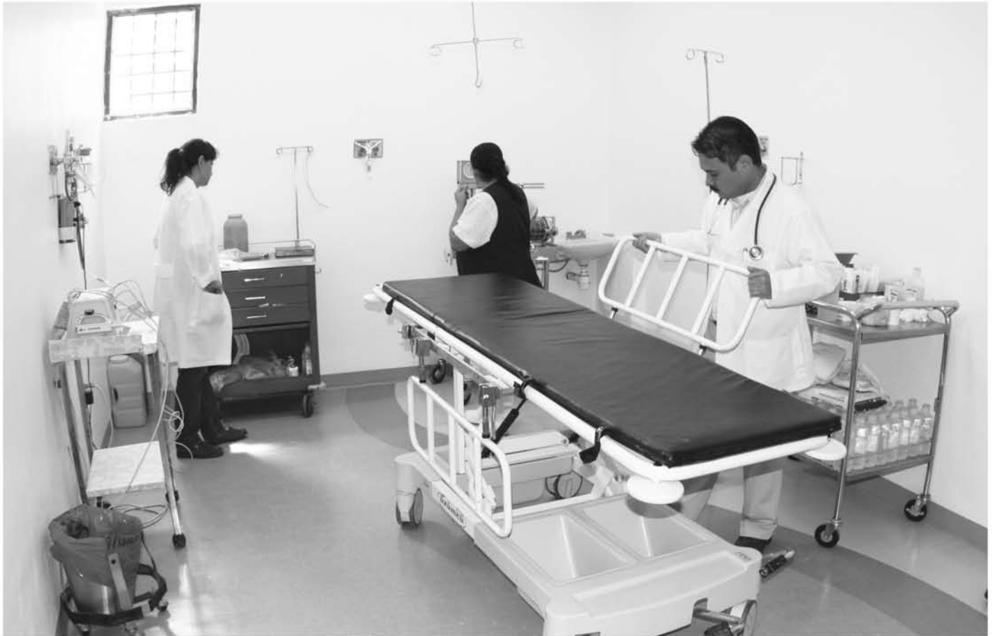
Remodelación de hospital.