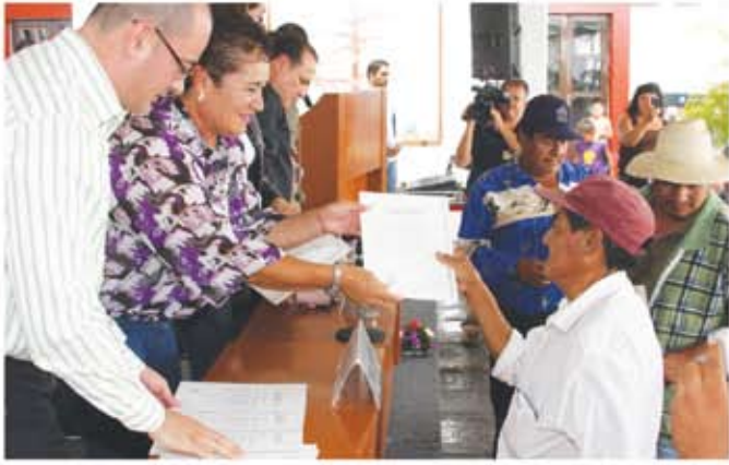
Arriba: entrega de escrituras