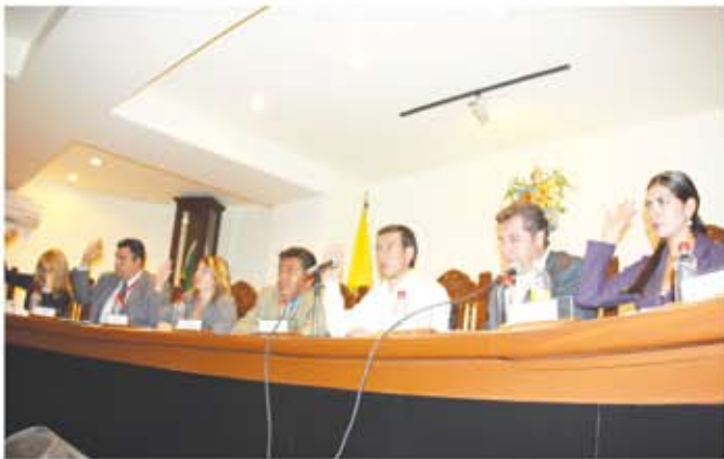
Arriba: botación en seccion de ayuntamiento Abajo: Inaguración leche liconsa.