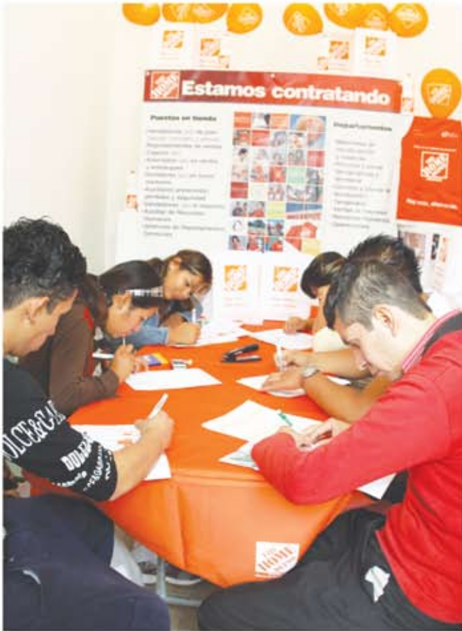
Arriba: Expo Empleo Tlaquepaque. Derecha: Mantenimiento a jardines.