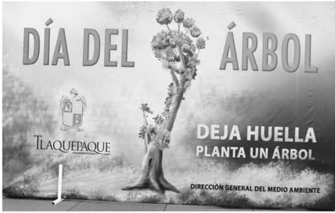
Arriba y abajo: Día del Arbol